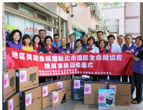
感謝 3490 第四分區六個扶輪社贊助本會購買事務設備