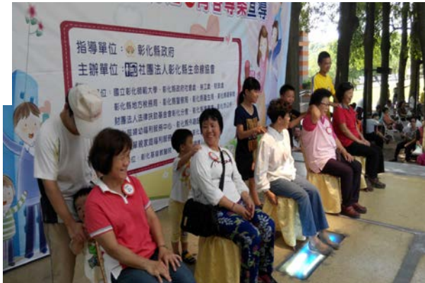
左上圖：志工協助民眾進行心情溫度計量表施測 右上圖：生命線活動攤位自殺防治宣導 左下圖：慶祝祖父母節—感恩奉茶禮