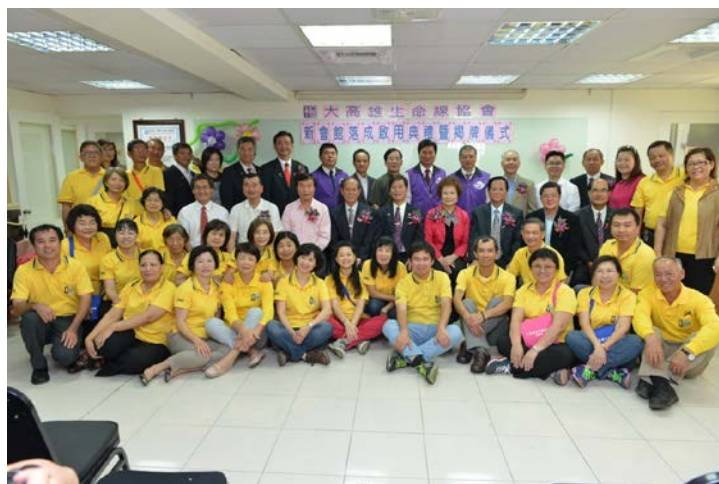
與會貴賓與本會志工們合影

新家的地址：高雄市岡山區中山北路 187 號 7 樓，行政電話：07-6245995，協談服務專線：1995，歡迎舊雨新知，繼續支持與肯定。